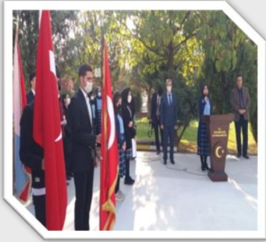
10 Kasım Töreni